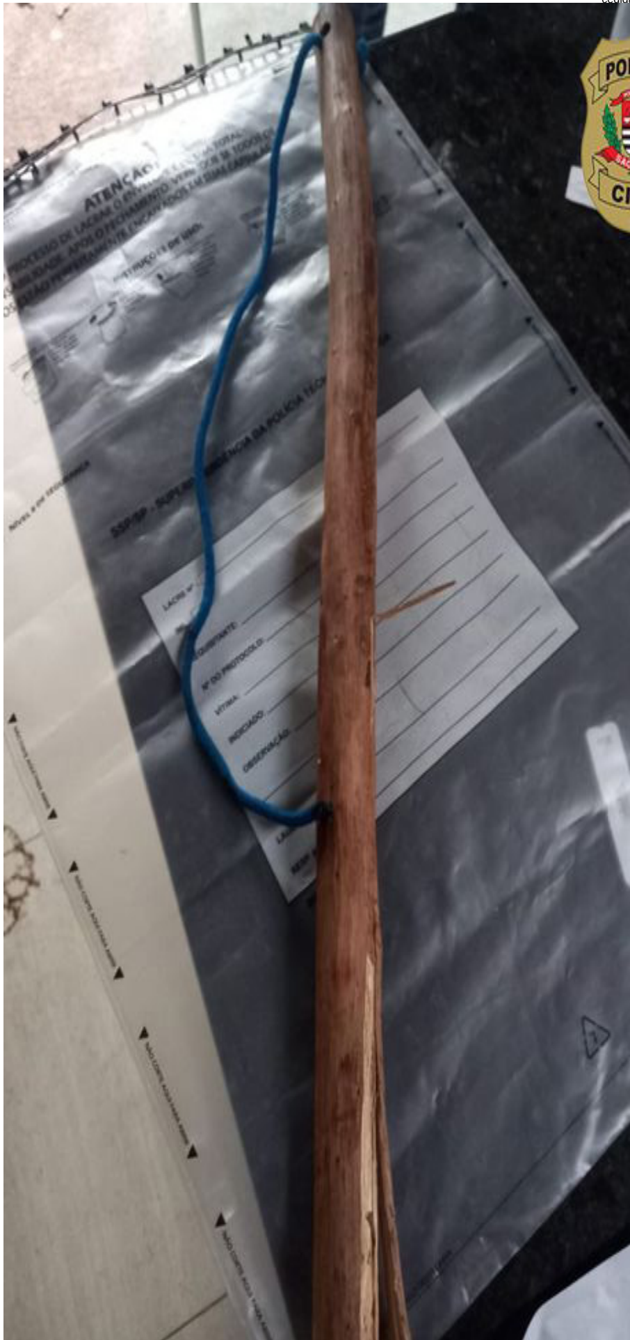
Vítima de 31 anos recebeu golpes de faca e pedaço de madeira encontrado com manchas de sangue