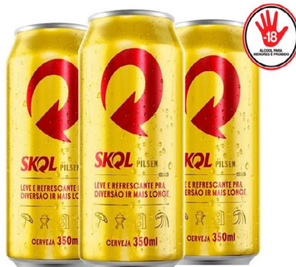
CERVEJA SKOL PILSEN LATA 350ml