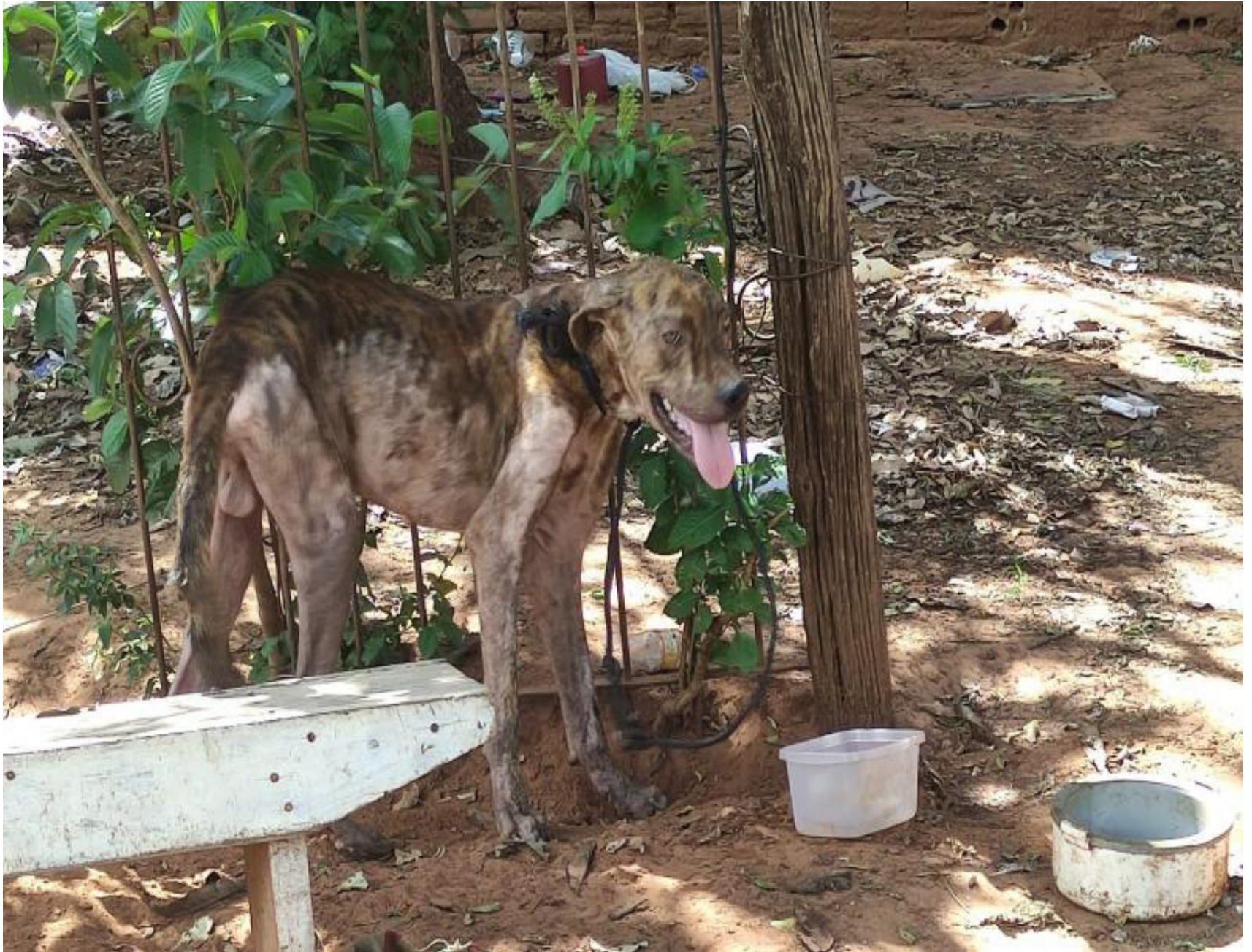
Cão foi encaminhado ao abrigo de animais em Pirapozinho