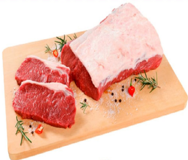
CONTRA FILÉ FRIBOI PEÇA/CRY Kg