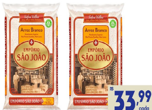
ARROZ EMPÓRIO SÃO JOAO TIPO 1 AGULHINHA 5Kg

PREÇO EXCLUSIVO Clube Avenida R$ 29,99 cada