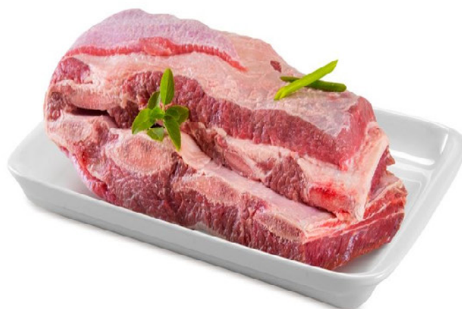
COSTELA DE BOI "MINGA" Kg