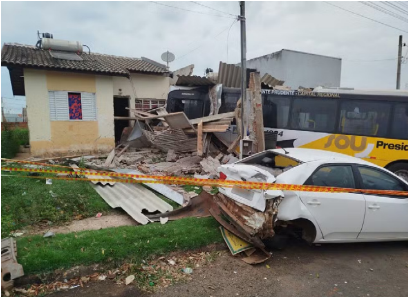
Coletivo invadiu 2 casas no conjunto habitacional na manhã desta segunda-feira