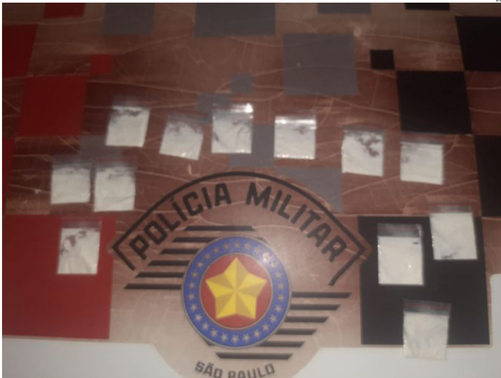
Sachês com cocaína foram encontrados com o idoso