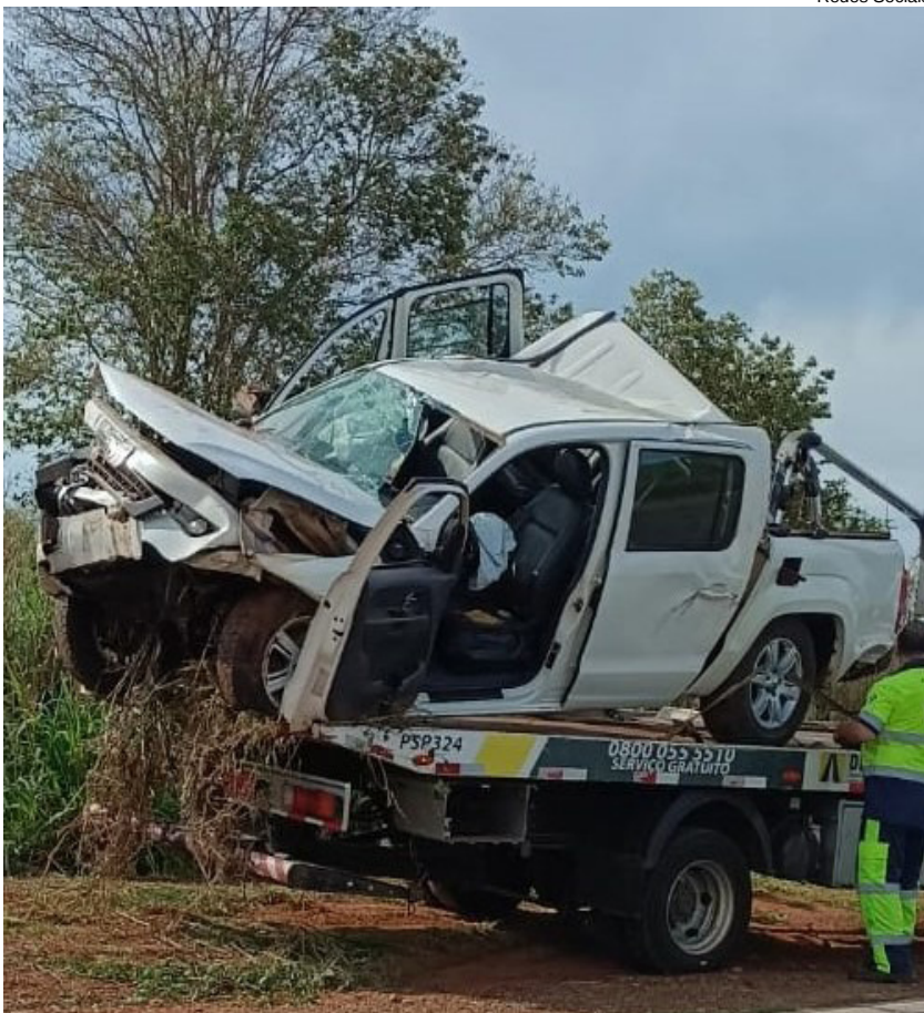
Acidente ocorreu por volta das 12h de sábado, caminhonete capotou e bateu contra árvore