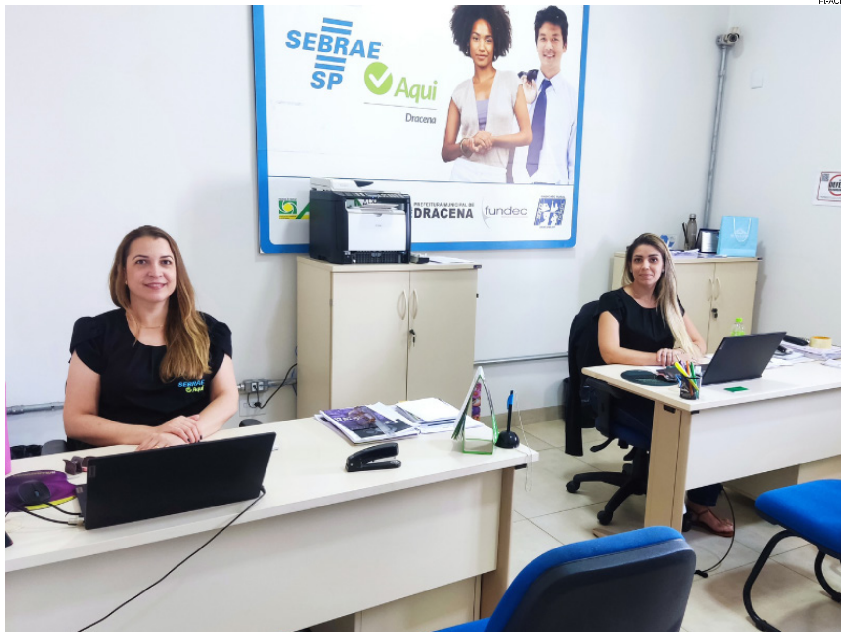
Sebrae Aqui Dracena: apoio aos empreendedores