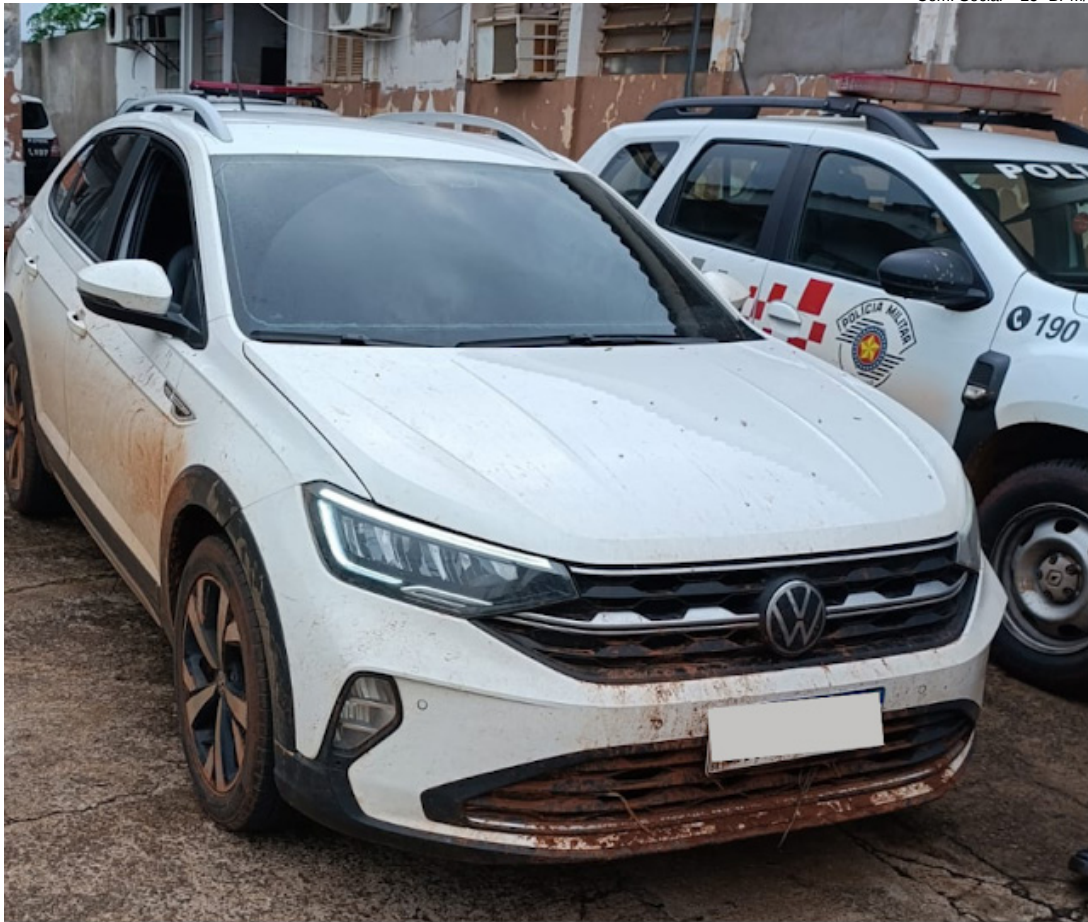
Com. Social – 25º BPM/I