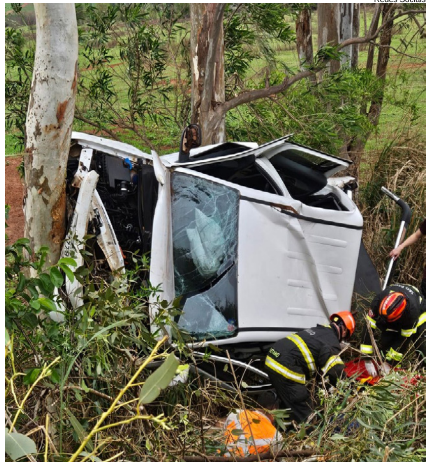
Condutor foi socorrido em estado grave