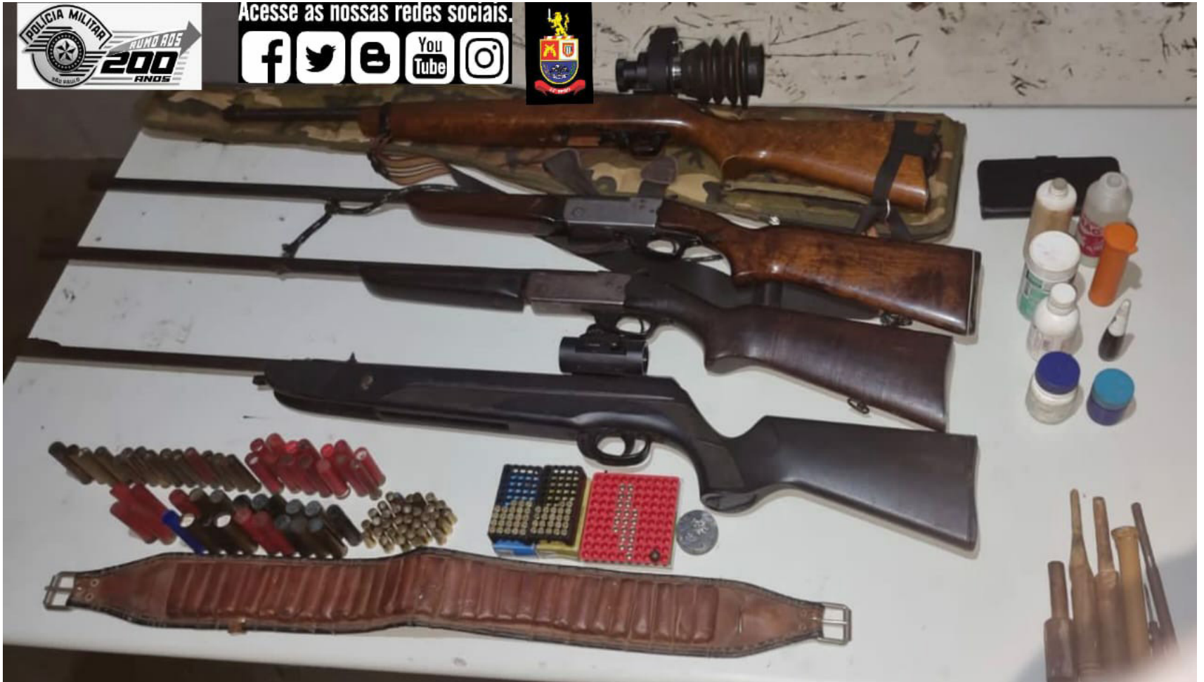
Armas de fogo de uso restrito e munições apreendidas neste domingo