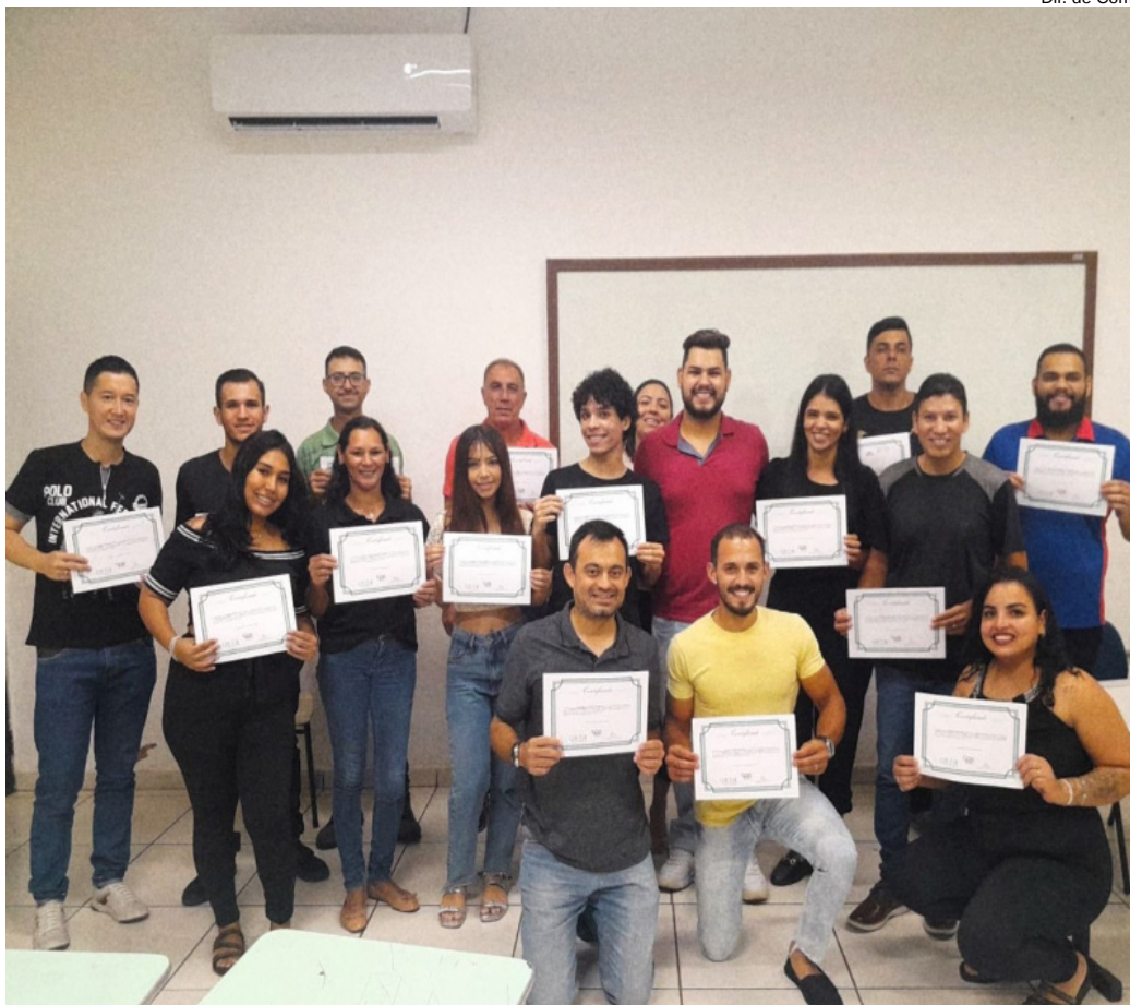
Curso encerrou no último dia 23 com a entrega dos certificados

O curso de Técnicas em Vendas, realizado em parceria entre a Prefeitura de Dracena e a Escola Técnica Professora Carmelina Barbosa, chegou ao fim com a formação de 18 alunos. O curso foi finalizado no último dia 23, com a entrega de certificado.