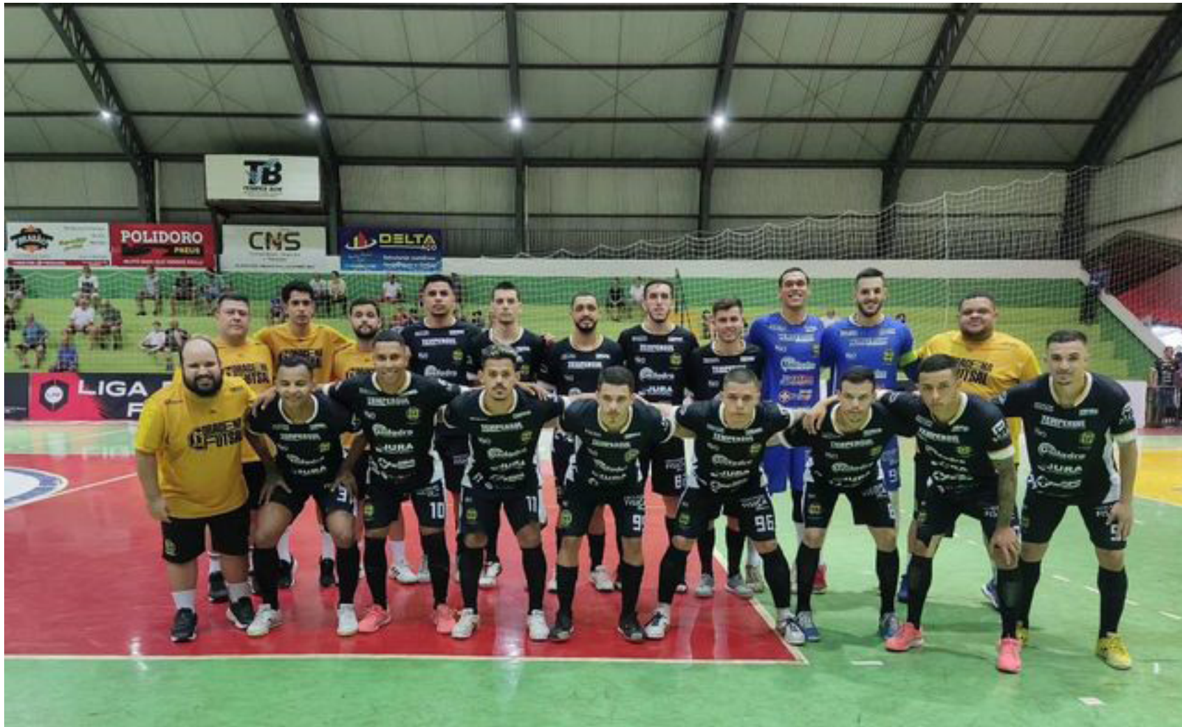
Dracena Tempersul Unifadra joga contra o Jahu, 2ª feira, em Botucatu