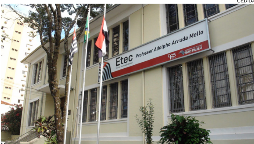
ETEC Professor Arruda Mello, de Presidente Prudente