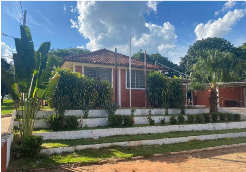
ETEC Professora Carmelina Barbosa, de Dracena

Interessado deve se inscrever pelo site vestibulinhoetec.com.br , até 26/11; são mais de 92 mil vagas em todo Estado