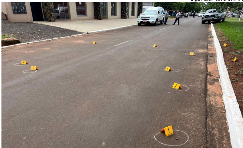
Local do crime ocorrido no último dia 5 de novembro em Sete Quedas (MS)