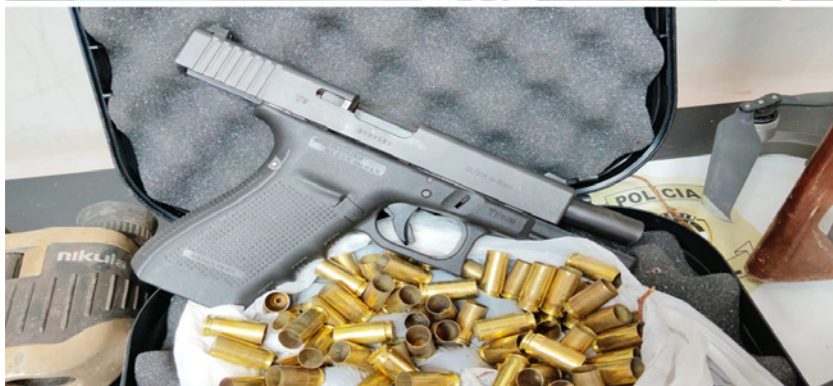
Mais de 10 arma e quase mil munições foram apreendidas