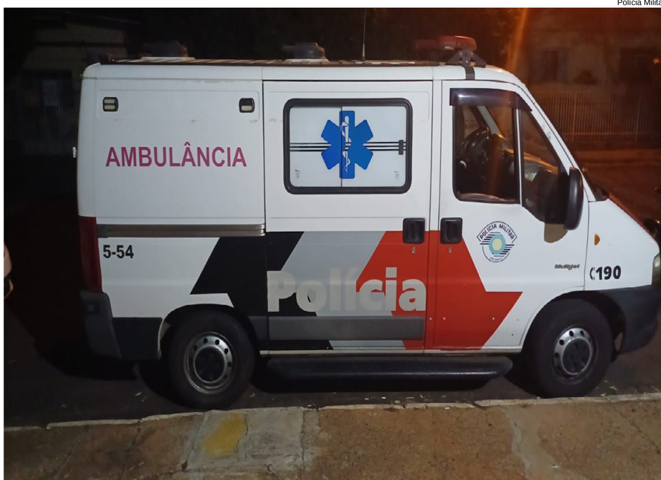
Ambulância da PM retornava da capital e seguia para Adamantina