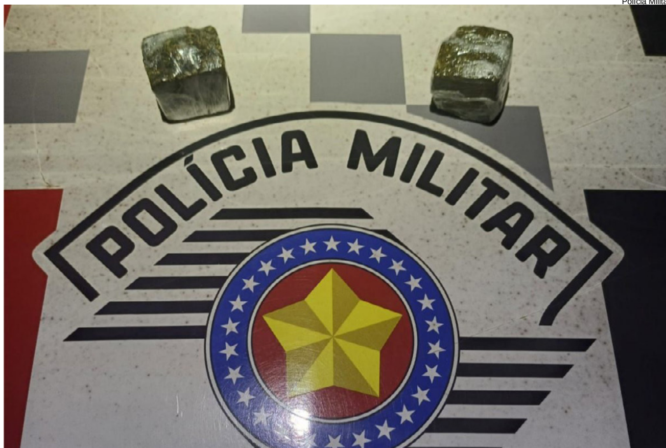
Droga apreendida pesou 47 gramas