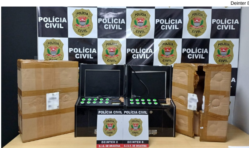
Duas máquinas caça-níqueis apreendidas em casa no bairro Sol Nascente II, em Dracena