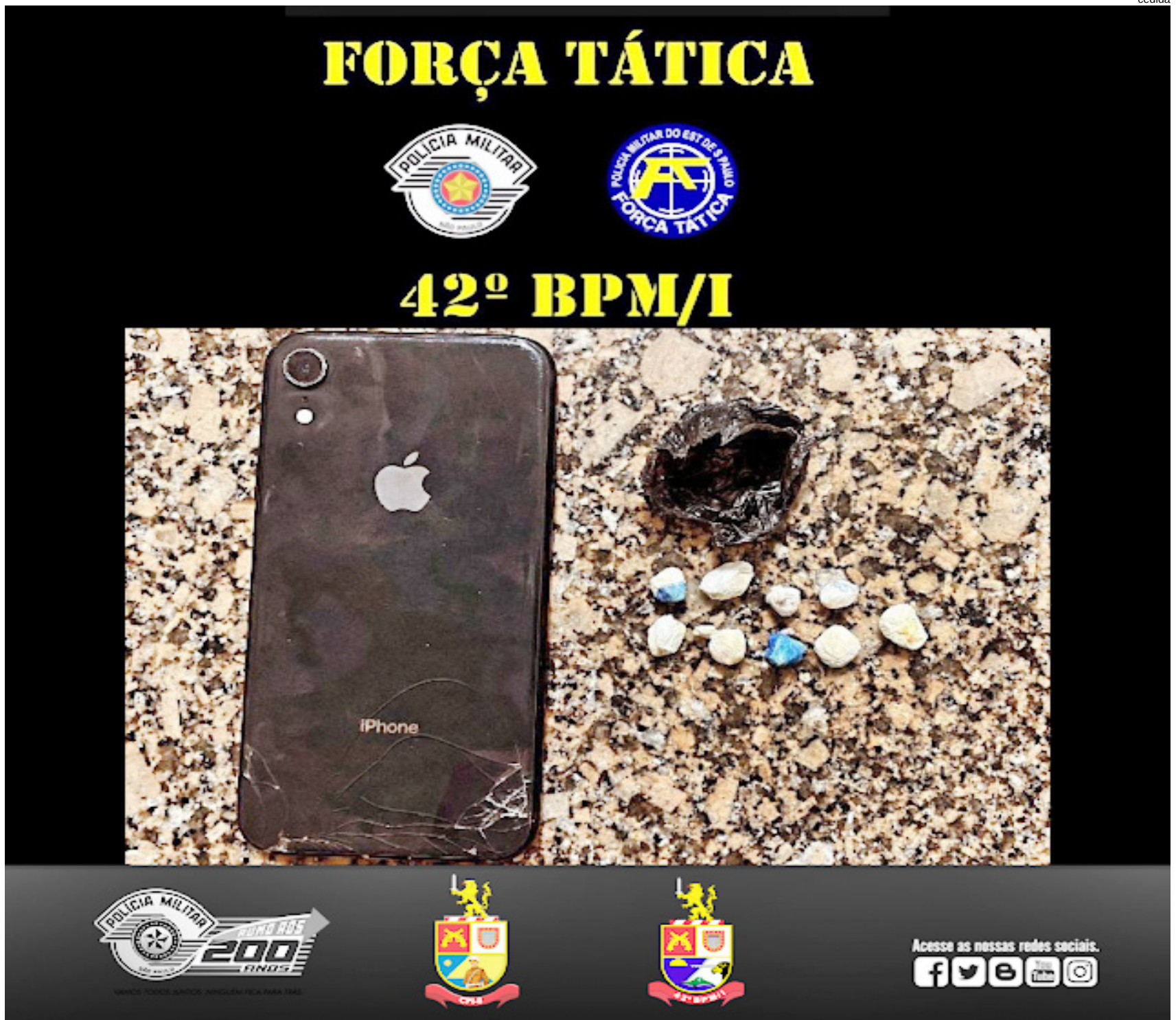
Nove porções de crack foram encontradas pela PM