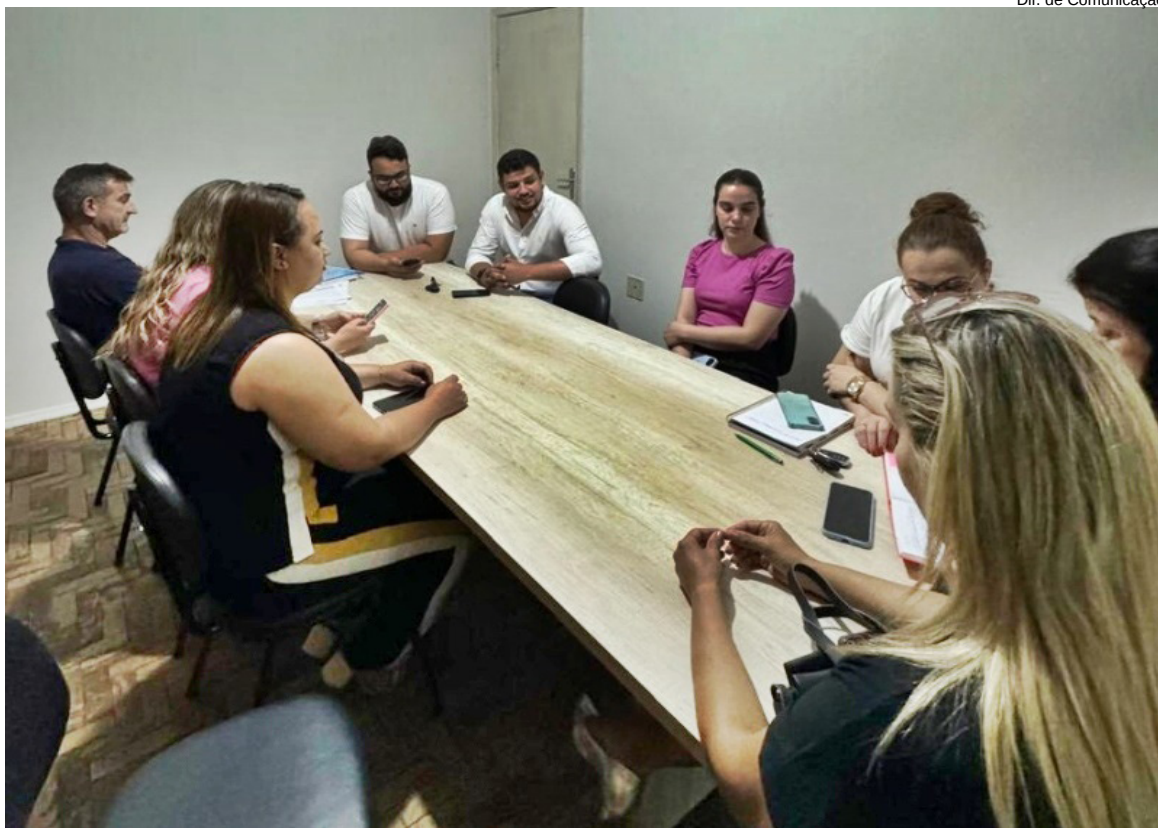
Reunião de transição entre a equipe da Secretaria de Saúde e Higiene Pública e a equipe da Biogesp

As unidades de Estratégia Saúde da Família (ESFs) de Dracena, administradas pela empresa Biogesp não funcionaram nesta sexta-feira (1º) e permanecerão fechados na próxima segunda-feira (04). Os atendimentos serão retomados na terça-feira, (05).