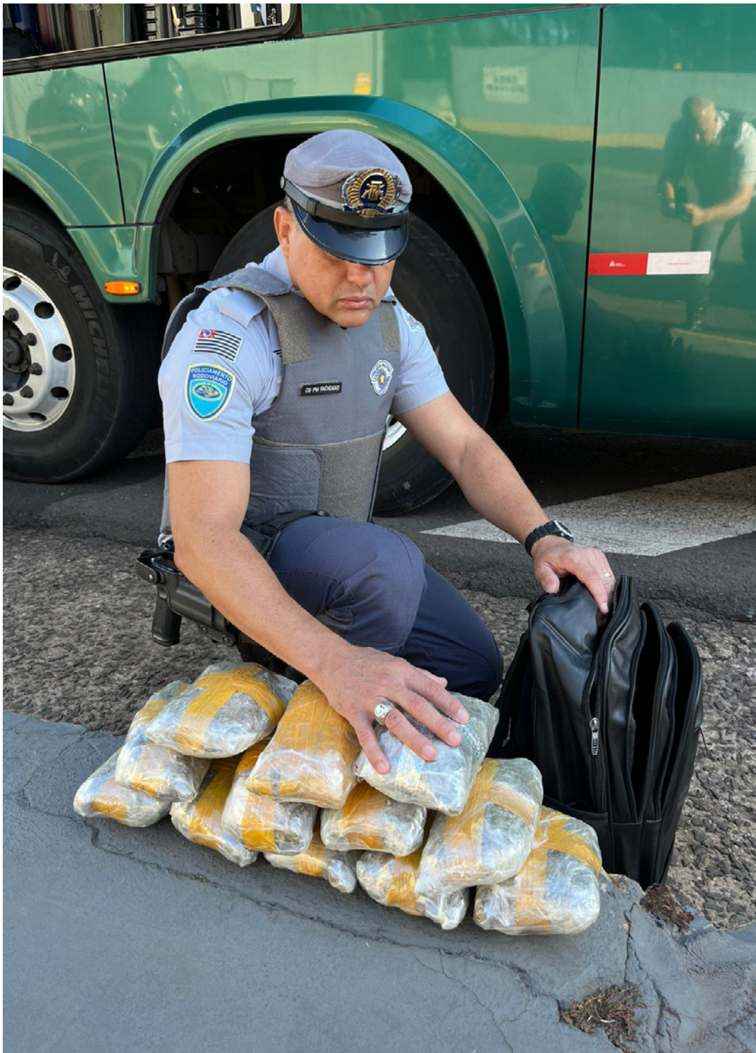
Doze pacotes com a droga estavam na mochila do passageiro de 27 anos