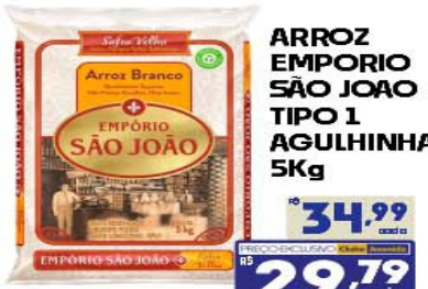
ARROZ EMPÓRIO SÃO JOÃO TIPO 1 AGULHINHA 5Kg