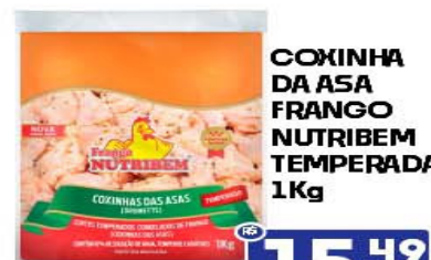
COXINHA DA ASA FRANGO NUTRIBEM TEMPERADA 1Kg