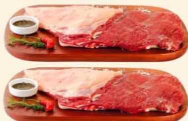
FRALDINHA BOVINA FRESCA / PEDAÇO CRY Kg