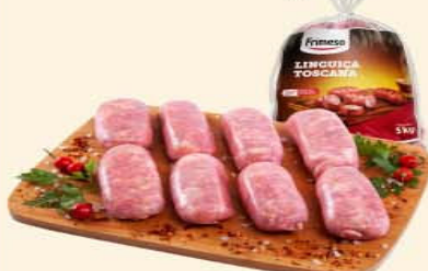
LINGUIÇA TOSCANA FRIMESA Kg