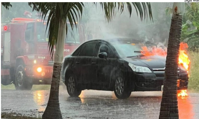
Chovia no momento do incêndio no veículo