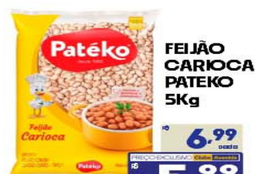
FEIJÃO CARIOCA PATEKO 5Kg