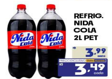
REFRIG. NIDA COLA 2L PET