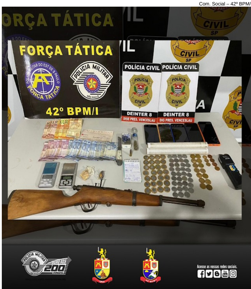
Com. Social – 42º BPM/I