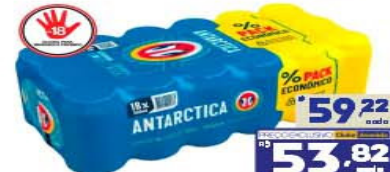
CERVEJA ANTARCTICA PILSEN LATA 350ml PACK C/18

59,22 cada 53,82 cada NESTA EMBALAGEM A LATA SAI POR 2,99