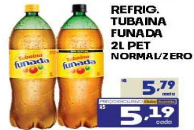
REFRIG. TUBAINA FUNADA 2L PET NORMAL/ZERO