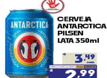
CERVEJA ANTARCTICA PILSEN LATA 350ml