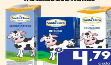
LEITE LONGA VIDA SANTA CLARA 1L T.P. INTEGRAL, DESNATADO Q. SEMI DESNATADO

4,79 cada LEVE 12 PAGUE 10 NESTA PROMOÇÃO A UNIDADE SAI POR: 3,99 cada