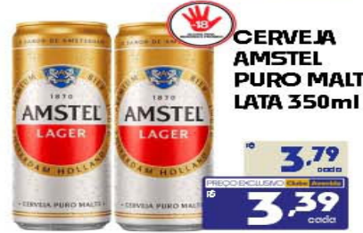
CERVEJA AMSTEL PURO MALTE LATA 350ml