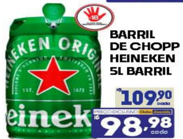
BARRIL DE CHOPP HEINEKEN 5L BARRIL

59,22 cada 53,82 cada NESTA EMBALAGEM A LATA SAI POR 2,99