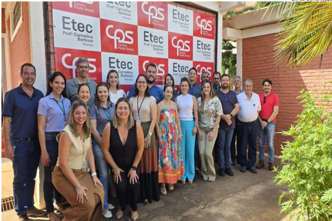
Dir. de Comunicação