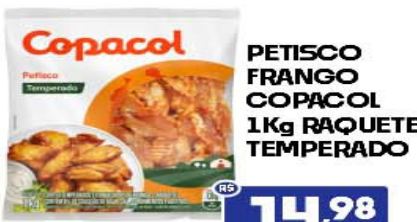
PETISCO FRANGO COPACOL 1Kg RAQUETE TEMPERADO