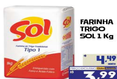
FARINHA TRIGO SOL 1 Kg