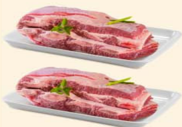
COSTELA DE BOI RIPA Kg

Dracena, Tupi Paulista e Junqueirópolis.