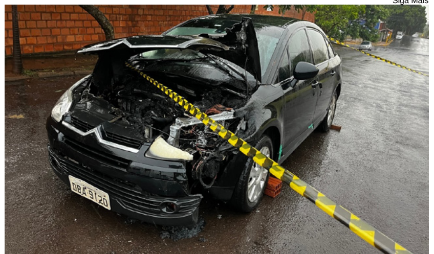
Danos foram concentrados no motor do carro