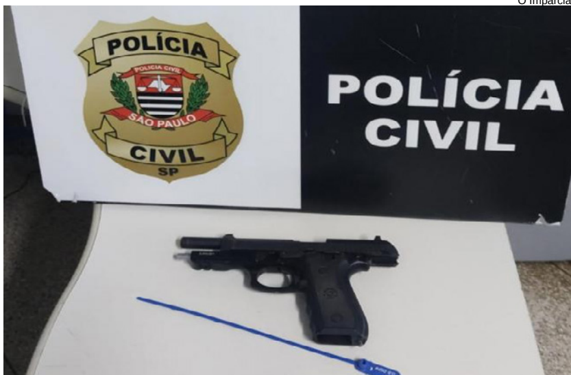
Arma utilizada para os crimes, apreendida pela Polícia Civil

Em nota, a SAP (Secretaria da Administração Penitenciária do Estado de São Paulo) declarou que lamenta as mortes ocorridas e revelou que abriu procedimento apuratório para acompanhar os casos.