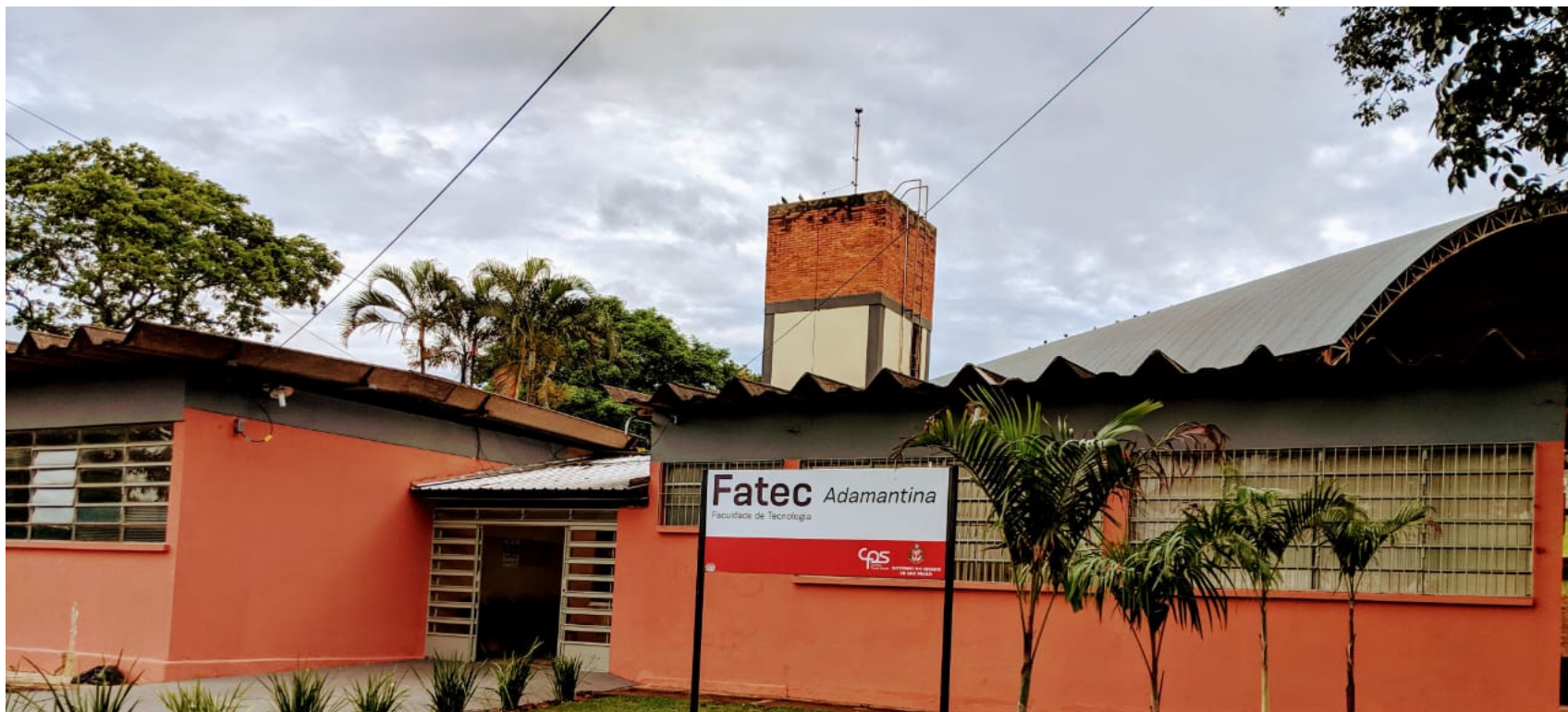
Fatec de Adamantina dispõe de 42 vagas e Presidente Prudente, 238 vagas