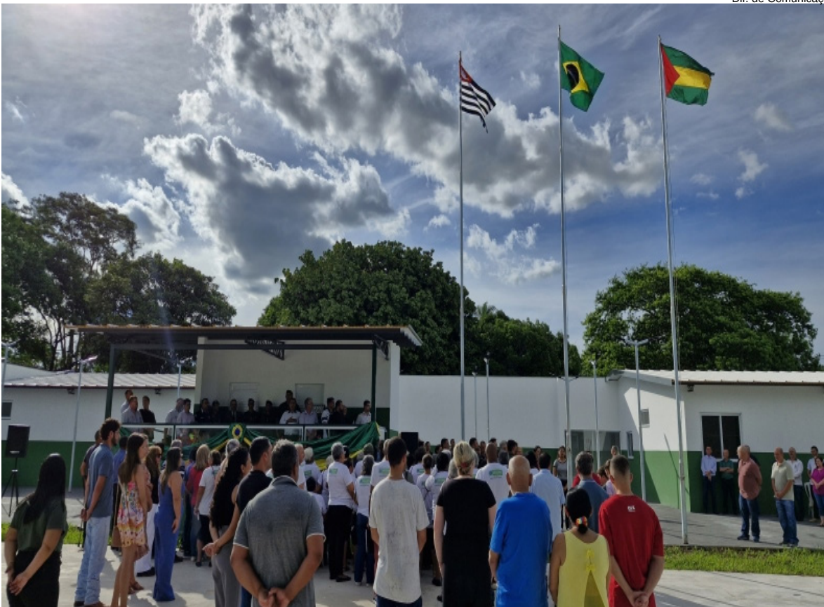
População presente na inauguração da nova instalação do TG