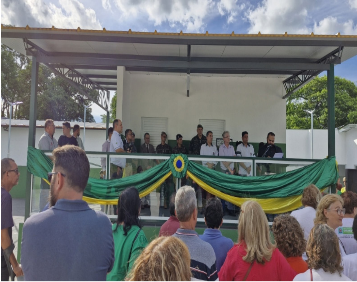
Autoridades participaram da cerimônia