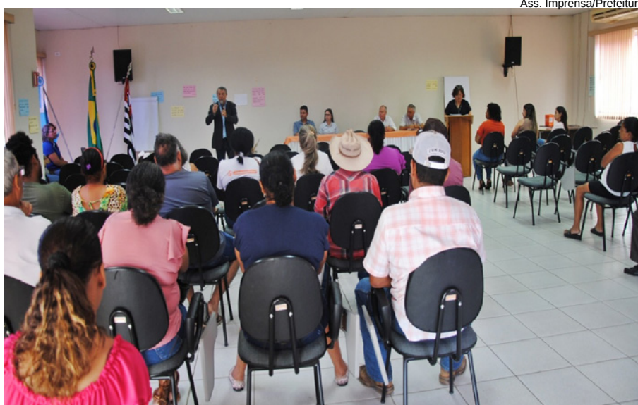
Entrega dos títulos aos moradores do J. Alvorada, em Junqueirópolis