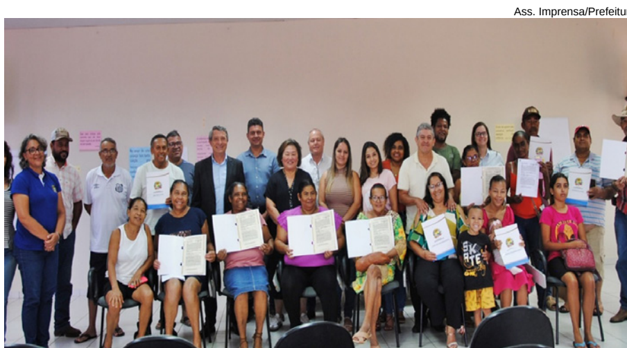
31 famílias foram atendidas na primeira etapa

ção dos terrenos para as 770 famílias tornou-se possível, enfatiza Iwaki, graças a um convênio firmado em 2022 pela Prefeitura com a Fundação Instituto de Terras do Estado de São Paulo (ITESP), órgão da Secretaria Estadual de Justiça e Cidadania e o Cartório de Registro de Imóveis de Junqueirópolis.