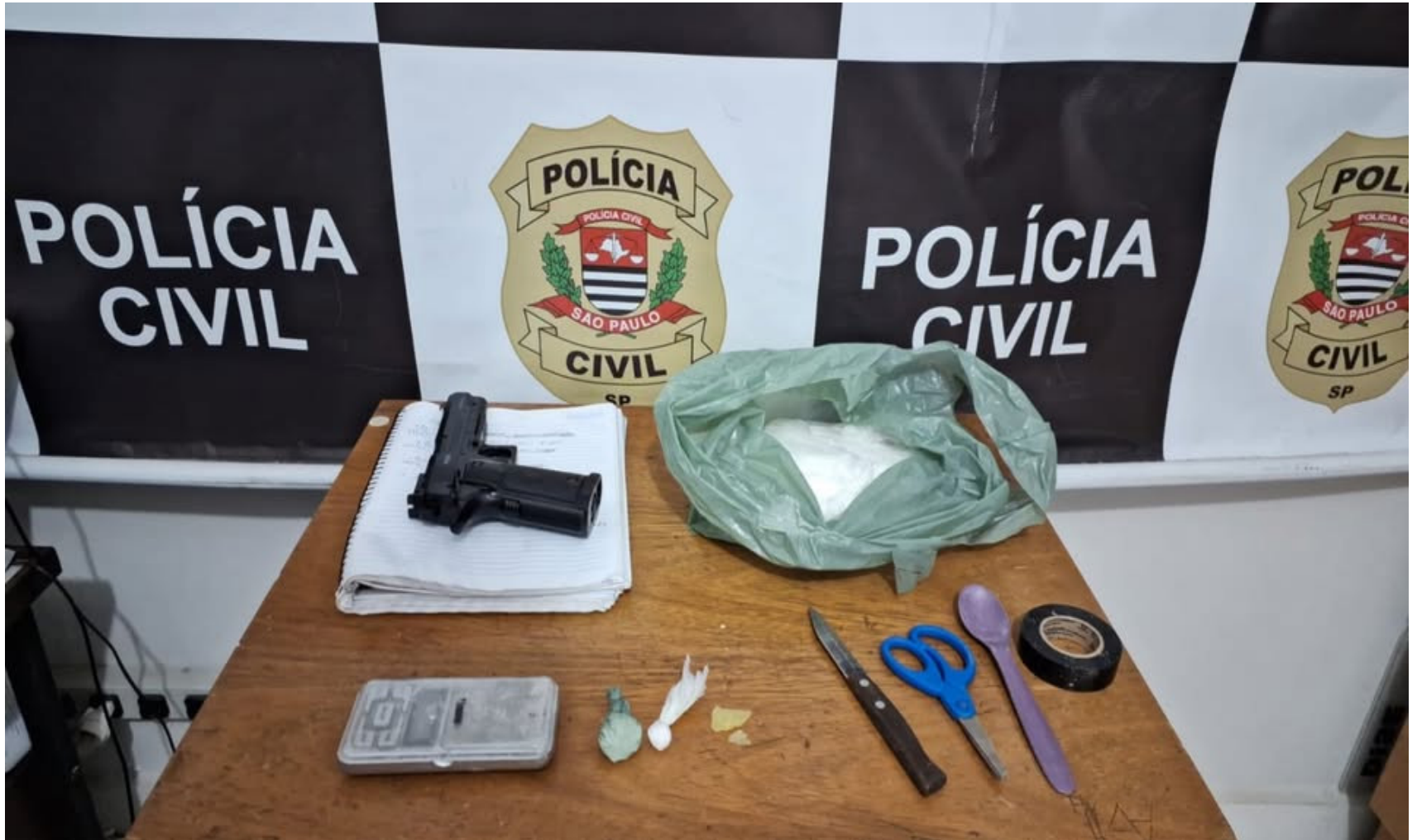
Drogas, simulacro de arma, balança e anotações sobre o tráfico apreendidos