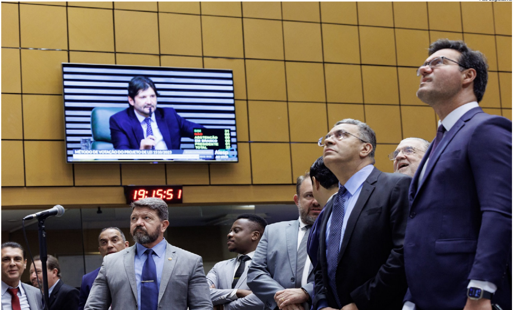
Sessão da Alesp de quarta-feira (4) que aprovou o projeto de lei