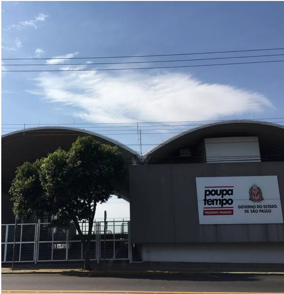
Poupatempo está localizado na avenida Brasil, Vila São Jorge

O Poupatempo de Presidente Prudente celebra 14 anos de funcionamento neste sábado (7). Desde a inauguração, a unidade contabiliza 4,8 milhões de atendimentos, sendo 63,5 mil serviços prestados em 2024.