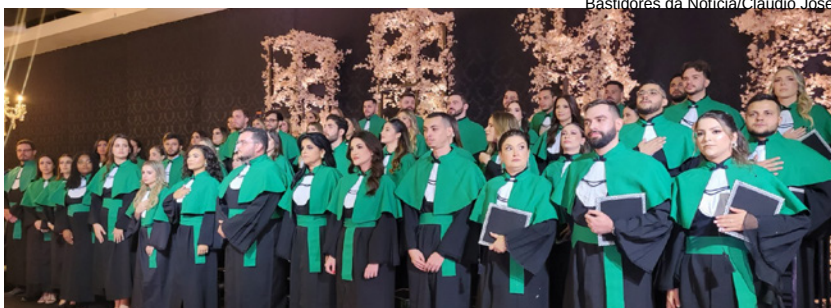
56 novos médicos fizeram a colação de grau