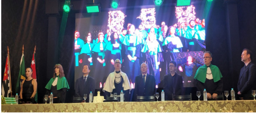
Formandos de Medicina da Unifadra na noite de quinta-feira