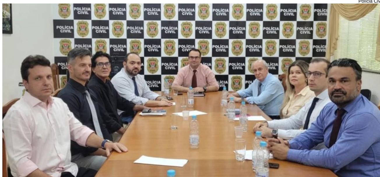
Reunião contou com presença dos delegados de abrangência da Seccional de Dracena