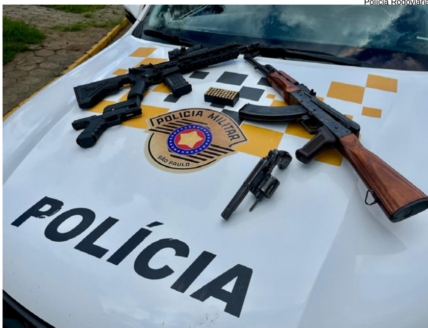
Arsenal de armas sofisticadas, além de munições e luneta foram apreendidos no carro