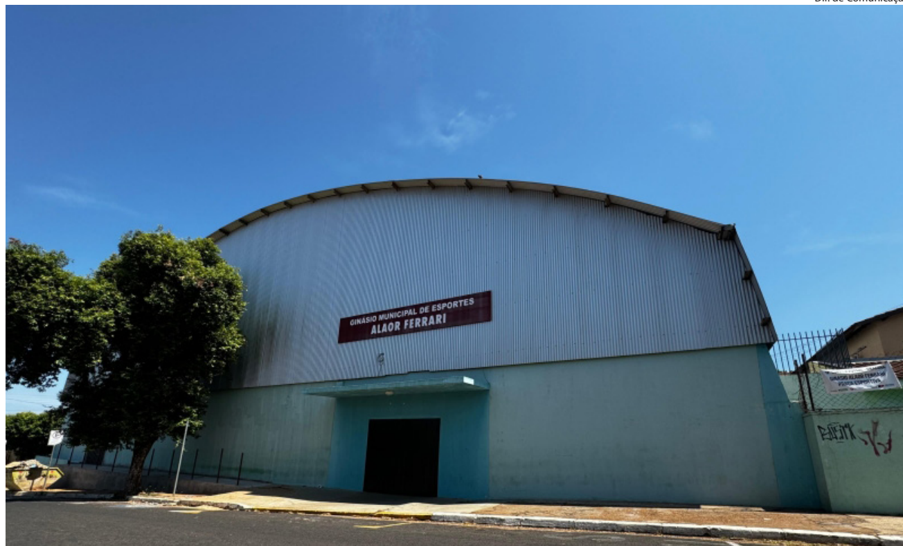
Ginásio de Esportes Alaor Ferrari passou por vistorias nesta terça-feira