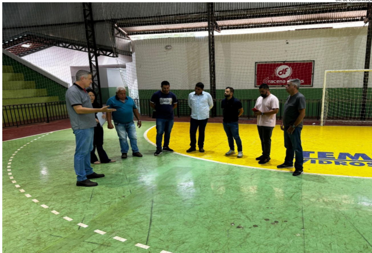
Objetivo foi analisar adequações necessárias apontadas pela Liga Nacional de Futsal (LNF)