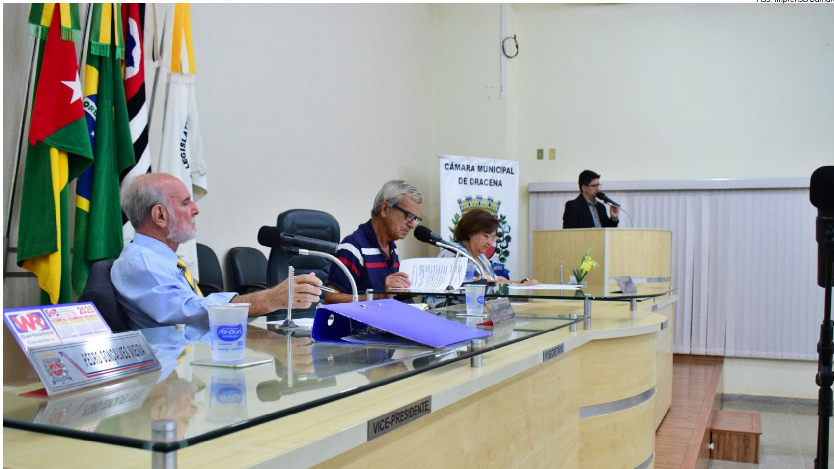
Mesa Diretora da Câmara na votação do PL nesta segunda-feira