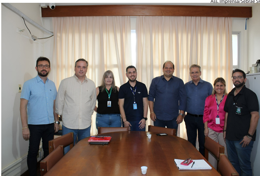
Tupi Paulista é a primeira cidade da Nova Alta Paulista a aderir ao programa

Evento de lançamento está previsto para acontecer em fevereiro