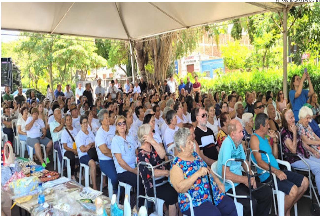
FT- BASTIDORES DA NOTÍCIA