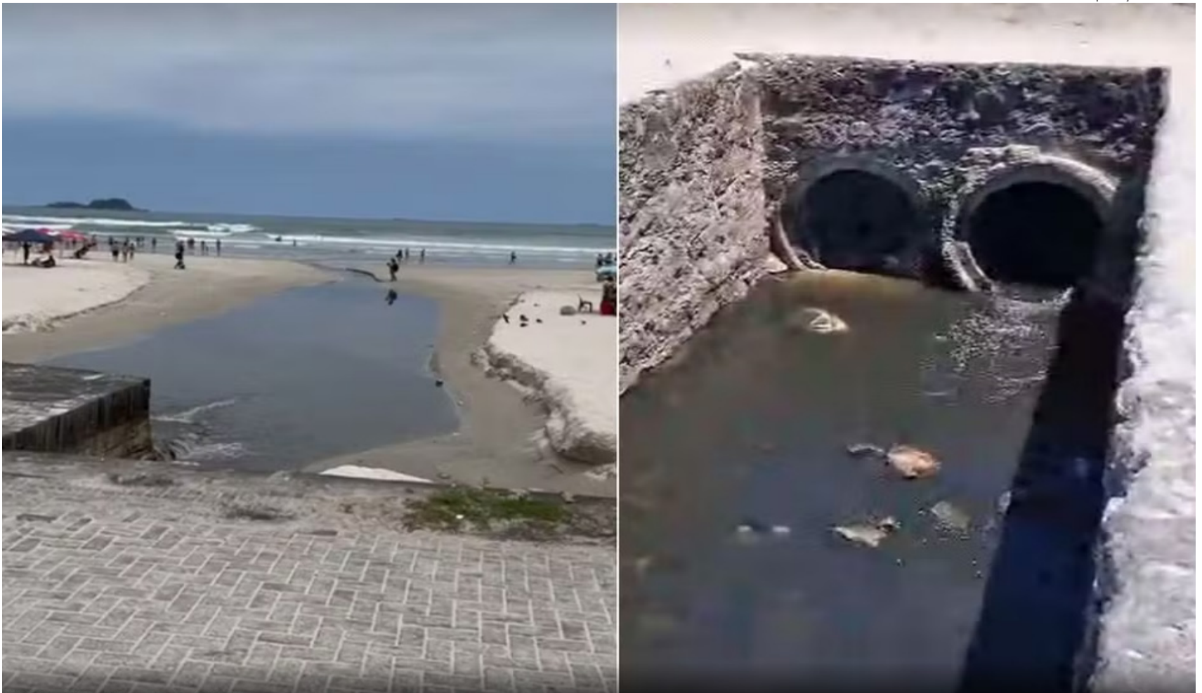
Vazamento de esgoto na Praia da Enseada, em Guarujá (SP)