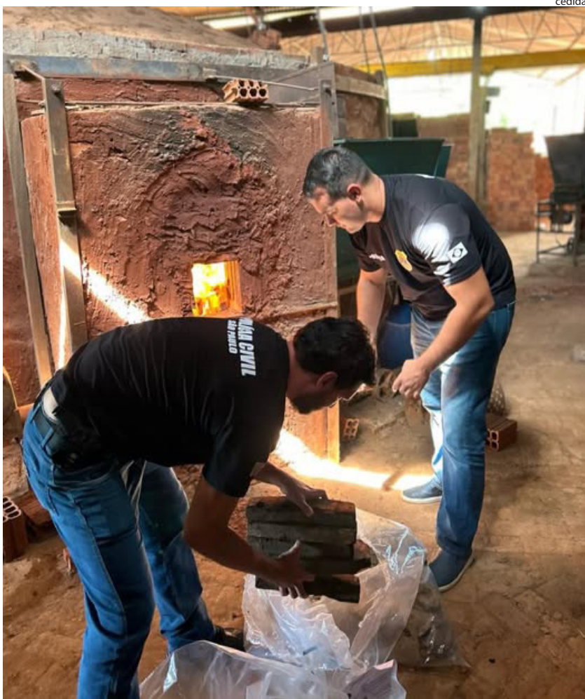
Drogas foram incineradas em empresa de cerâmicas em Paulicéia