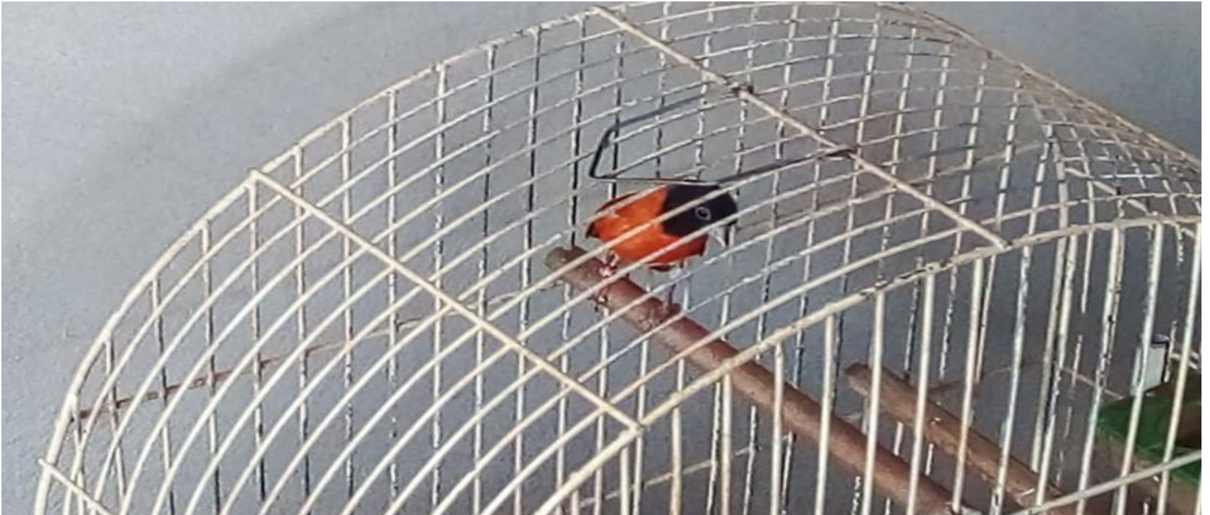
Ave da espécie Tarim ou Pintassilgo-da-Venezuela foi encontrada presa em uma gaiola