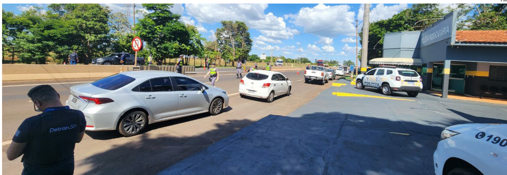
Quatro condutores foram flagrados no teste do etilômetro