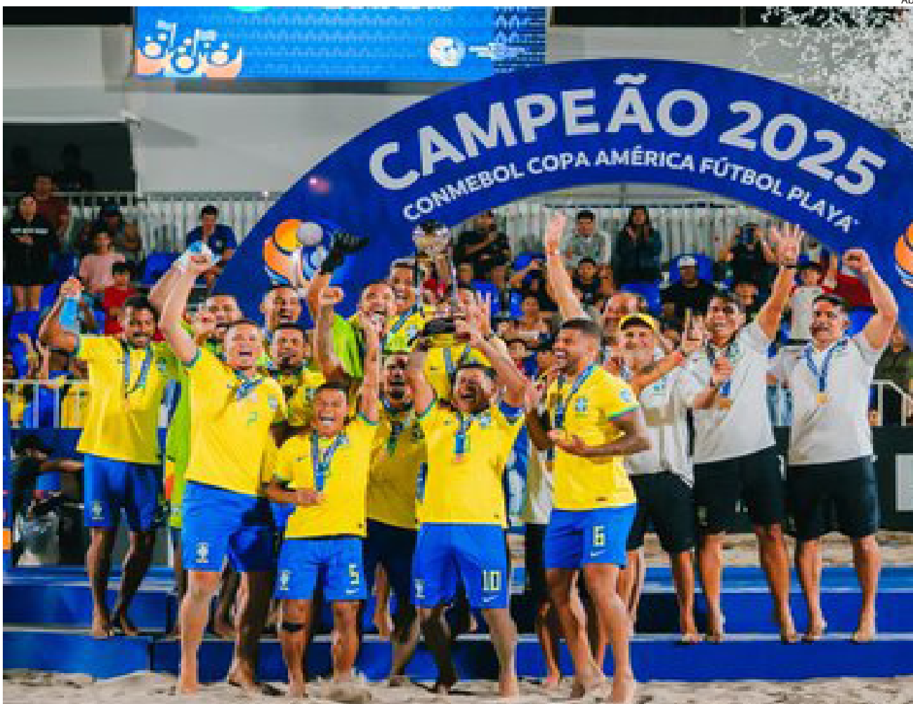
Jogo da vitória foi disputado na noite de ontem (2) no Chile