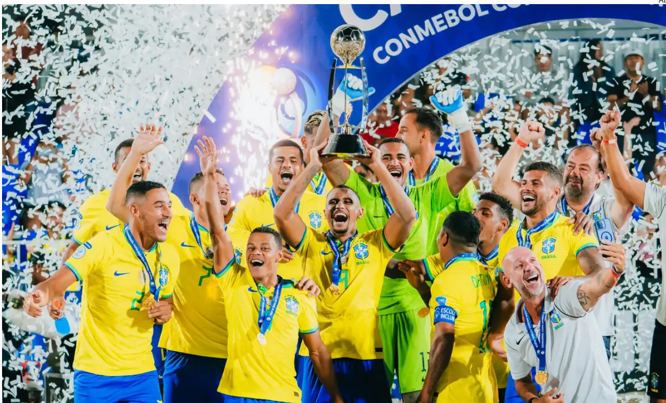
Título foi conquistado com vitória de 5 a 4 sobre o Paraguai