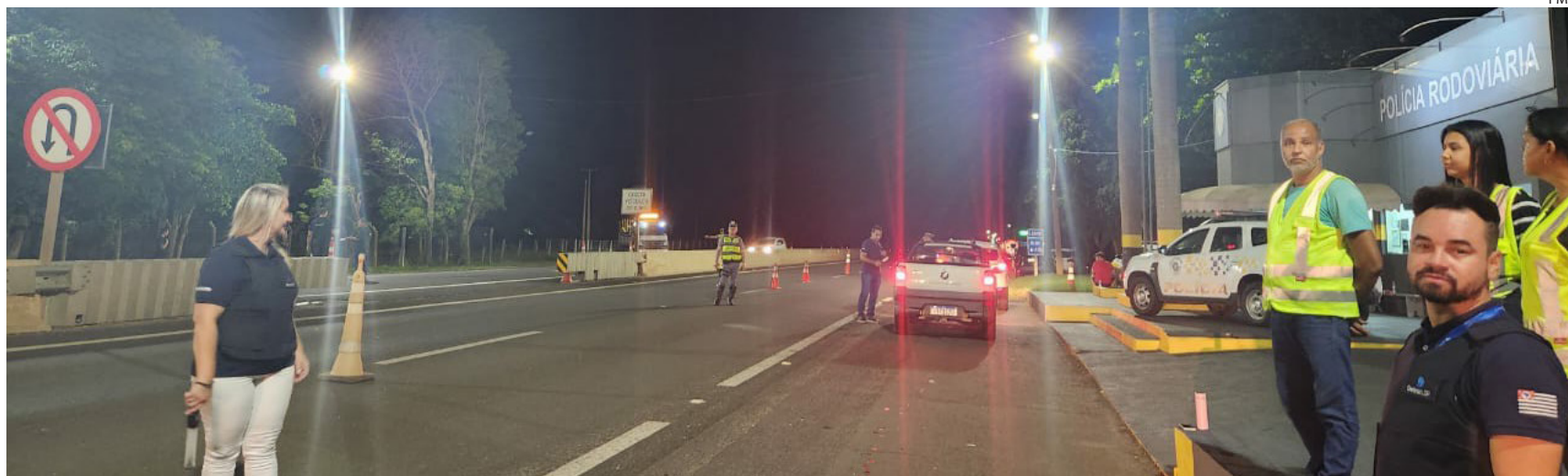
Operação ocorreu na noite de sábado (1)