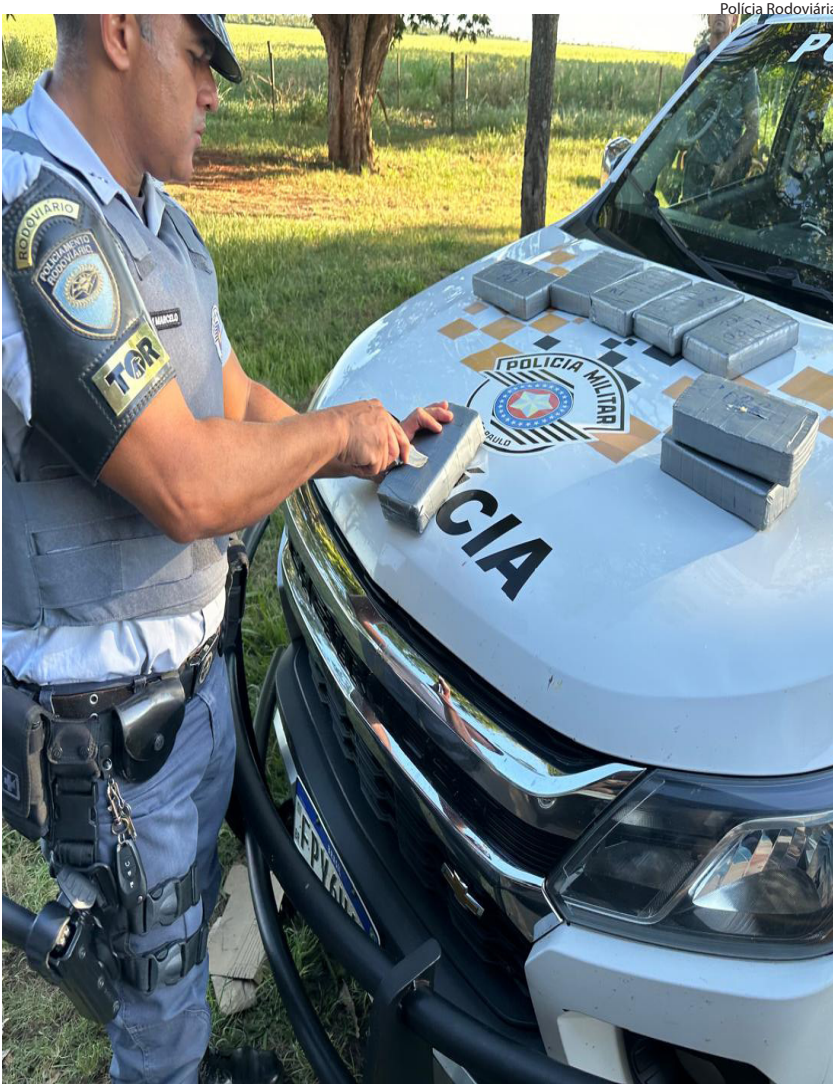
Casal boliviano de 26 e 20 anos foi preso com tabletes de cocaína e crack no ônibus