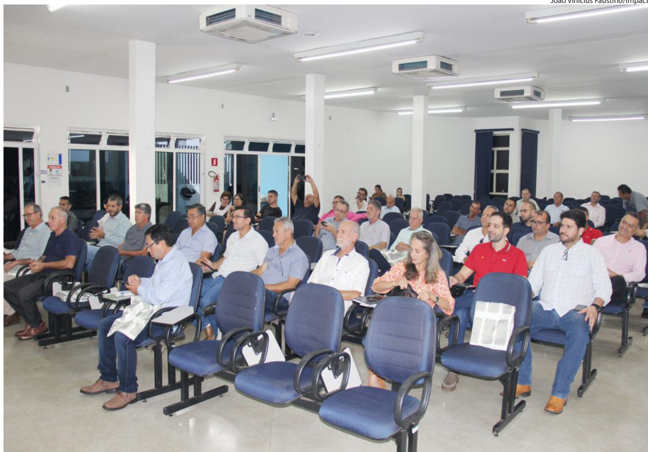
Prefeitos, vices e vereadores da região presentes no encontro