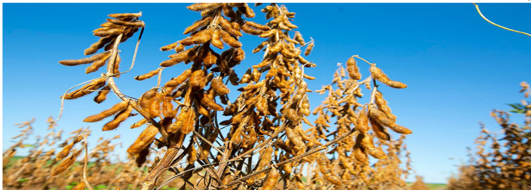
Opção permite o plantio antecipado da soja