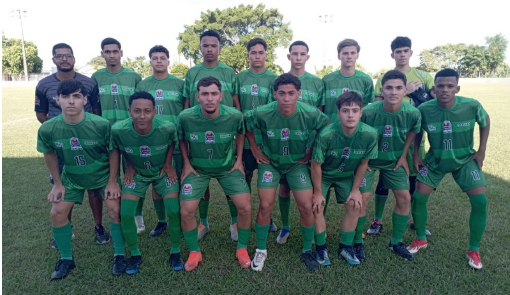
Equipes de Dracena venceram na rodada do fim de semana